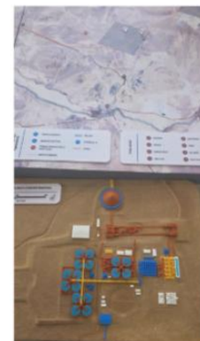
CONSULTA MINERA EL ABRA: EXPANSION PLANTA DESALADORA/CONCENTRADORA