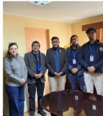
VISITA SEREMI MINVU Y DIRECTORA SERVIU