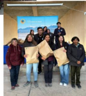
ACTIVIDAD PARA LAS MADRES Y MUJERES DE LA COMUNA