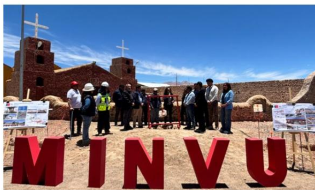
CEREMONIA COLOCACION PRIMERA PIEDRA PROYECTO PASEO COSTUMBRISTA