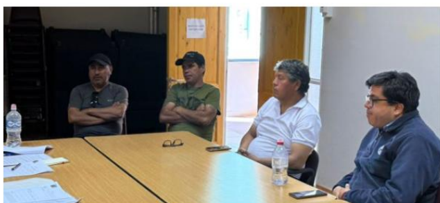
REUNION CON SEREMIA DE TRANSPORTES