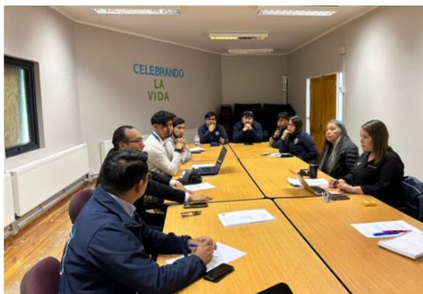
REUNION CON SUBDERE, DELEGADO PRESIDENCIAL PROVINCIAL Y SEREMI DE ENERGIA