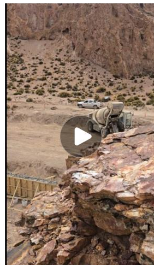
CONSERVACION GLOBAL MIXTA (OLLAGÜE - CALAMA)