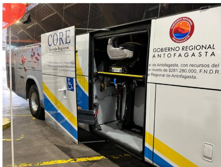
SITUACION BUS INTERCOMUNAL