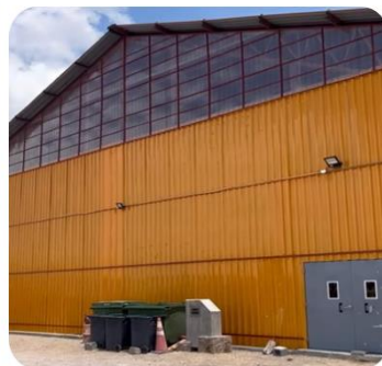
Mejoramiento fachada y cubierta Gimnasio Techado