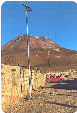
Ampliación De Instalación De Luminarias Peatonal, Ollagüe