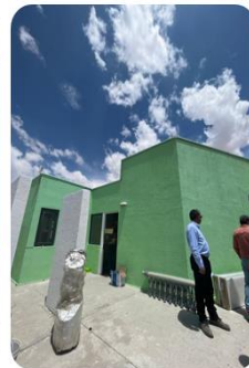
Mejoramiento de Sede Social Municipal de Ollagüe