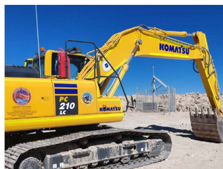
Adquisición de excavadora