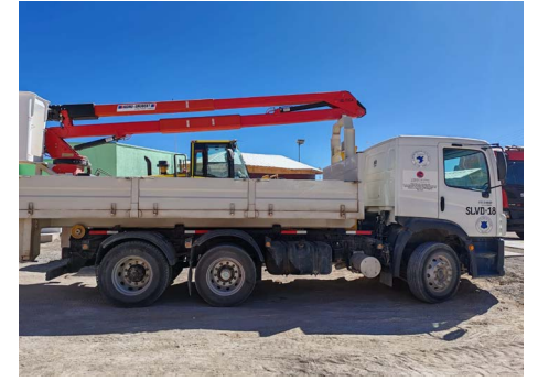
Adquisición de camión multipropósito.