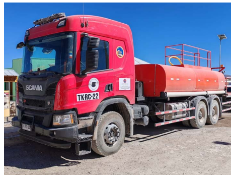
Adquisición de camión aljibe.