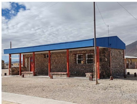
Mejoramiento infraestructura ex biblioteca