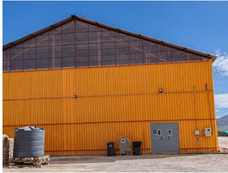
Mejoramiento fachada y cubierta gimnasio techado.