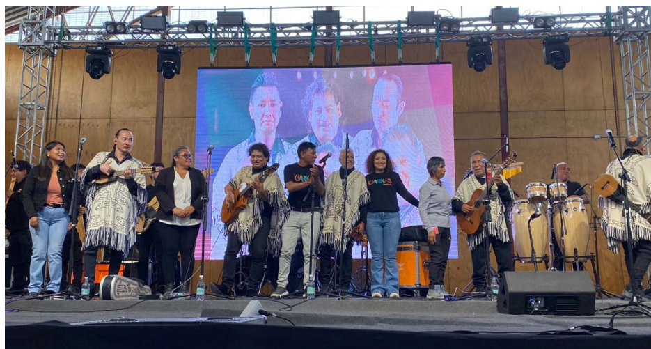
Segunda muestra cultural, entre Volcanes y Salares eternos, Ollagüe 2024