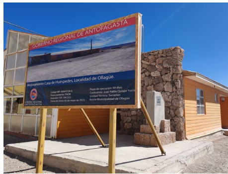
Mejoramiento infraestructura casa de huéspedes