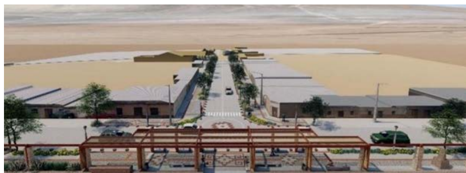
Construcción paseo costumbrista y cultural