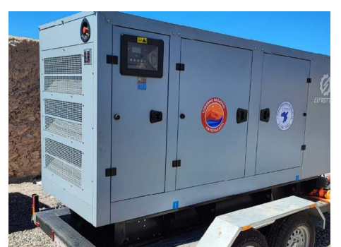
Adquisición de generador eléctrico 150 kva