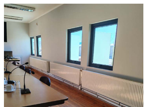
Proyecto de climatización sede social