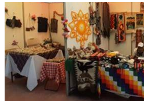
Participación ferias costumbristas andina