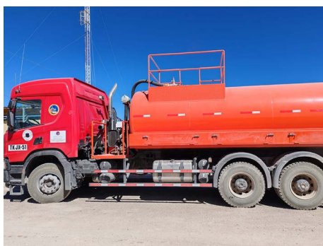
Adquisición de camión para aguas servidas