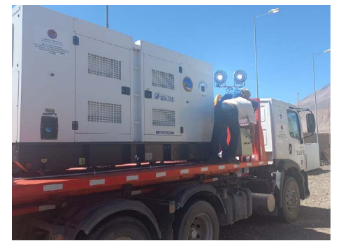
Adquisición de generador.