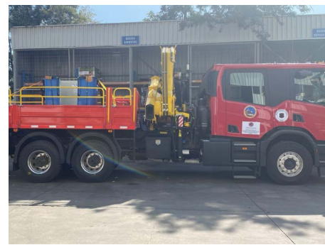
Adquisición camión pluma.