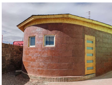
Contrucción de edificio para la infancia Pakapaka