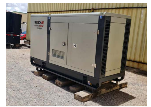
Adquisición de generador 110 kva