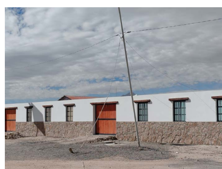
Mejoramiento cierre perimetrales