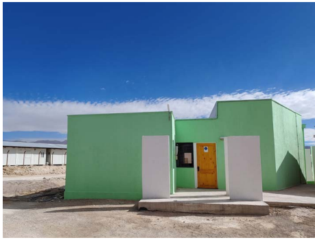
Mejoramiento Sede Social