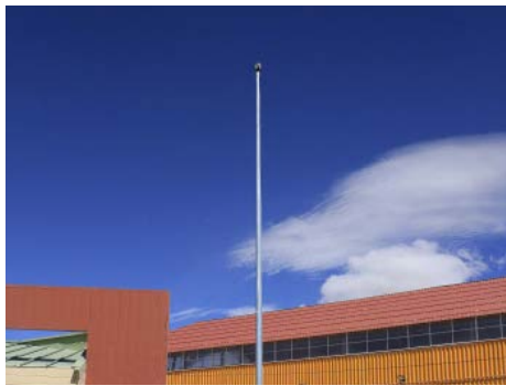
Instalación de pararrayos