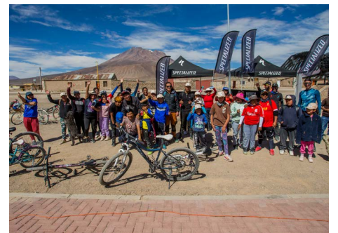
Segunda cicletada Amincha-Ollagüe.