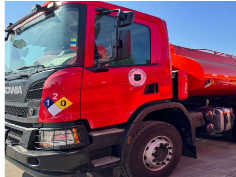
Adquisición de camión para transporte de combustible