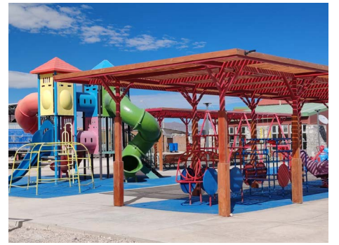
Mejoramiento plaza de juegos y máquinas de ejercicios