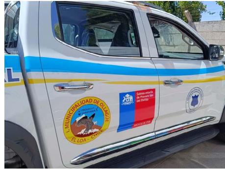
Adquisición camioneta patrullaje preventivo.