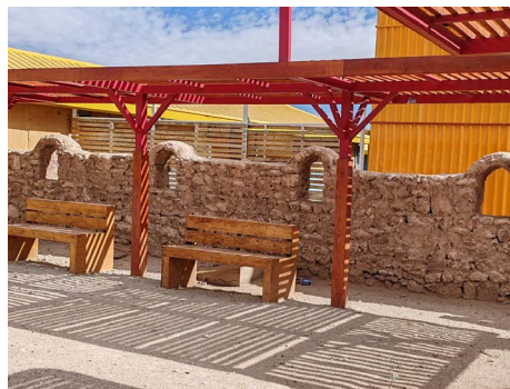
Mejoramiento infraestructura patio biblioteca municipal