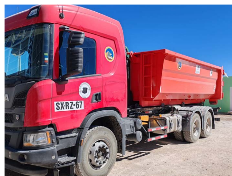
Adquisición de camión multipropósito