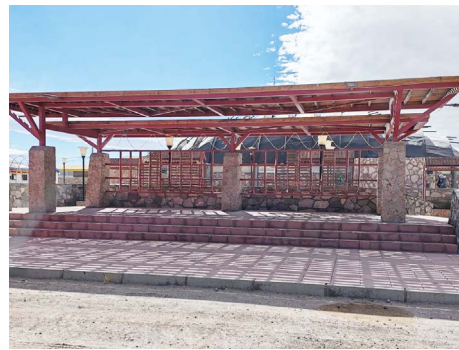
Mejoramiento plaza de armas .