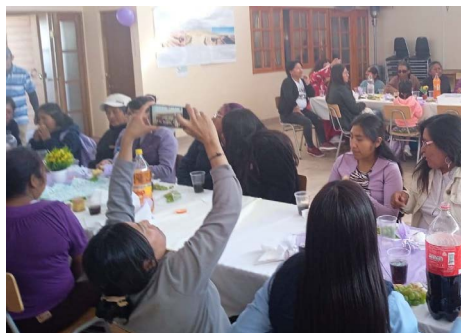
Conmemoración día internacional de la mujer.