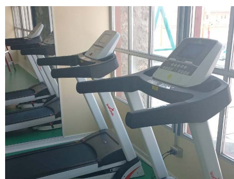
Habilitación de maquinaria deportiva.