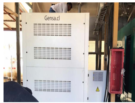
Adquisición de generador 550 kva