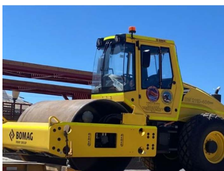
Adquisición de rodillo compactador