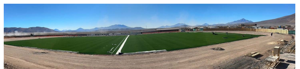
Mejoramiento integral estadio municipal