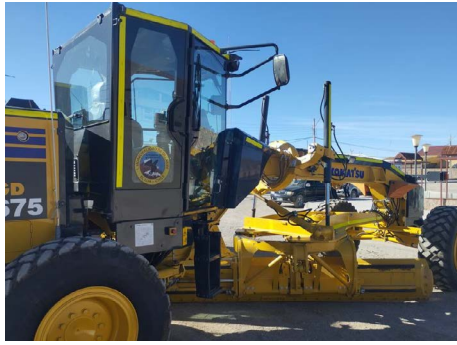
Adquisición de motoniveladora.