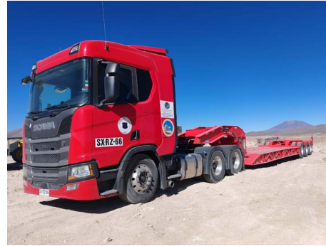
Adquisición de camión cama baja