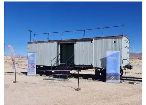
Habilitación de mirador ingreso al poblado.