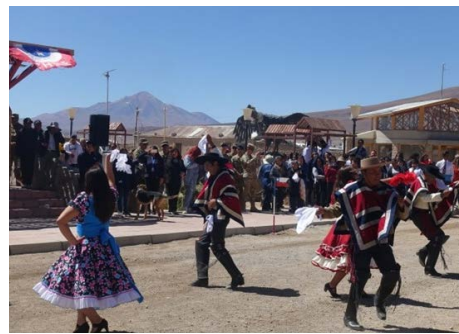
Celebración Fiestas PATrias