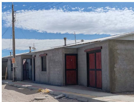
Mejoramiento cierre perimetrales