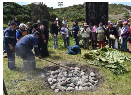
Paseo cultural adultos mayores