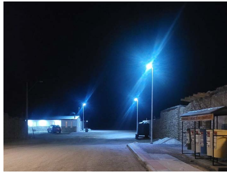
Instalación de luminarias solares en diversos sectores