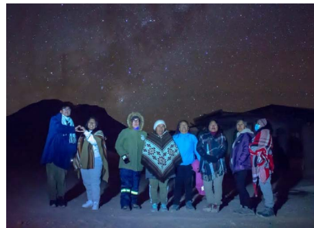
Realización de taller de astronomía andina