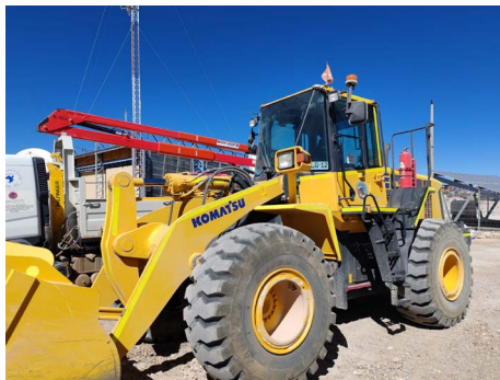
Adquisición de cargador frontal.